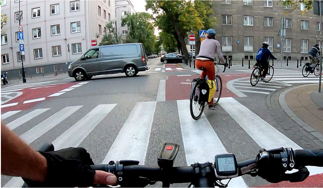
Rys. 4. Infrastruktura rowerowa (kontraruch oznakowany w wlotach skrzyżowania) na skrzyżowaniu ul. Hożej i ul. Emilii Plater, widok z ul. Hożej w kierunku zachodnim.