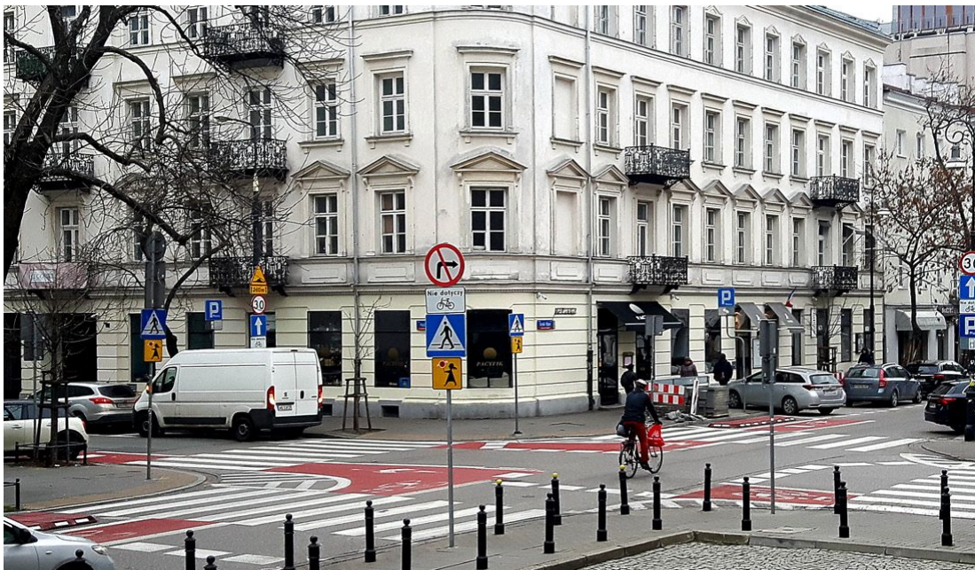
Rys. 3. Infrastruktura rowerowa (kontraruch oznakowany na wlotach skrzyżowania) na skrzyżowaniu ul. Hożej i ul. Emilii Plater, widok z północno-zachodniego narożnika skrzyżowania.