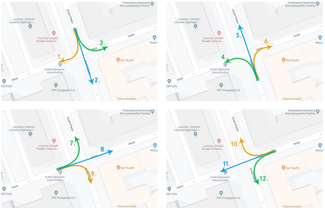
Rys. 5 - 8. Badane relacje – wszystkie możliwe kierunki.