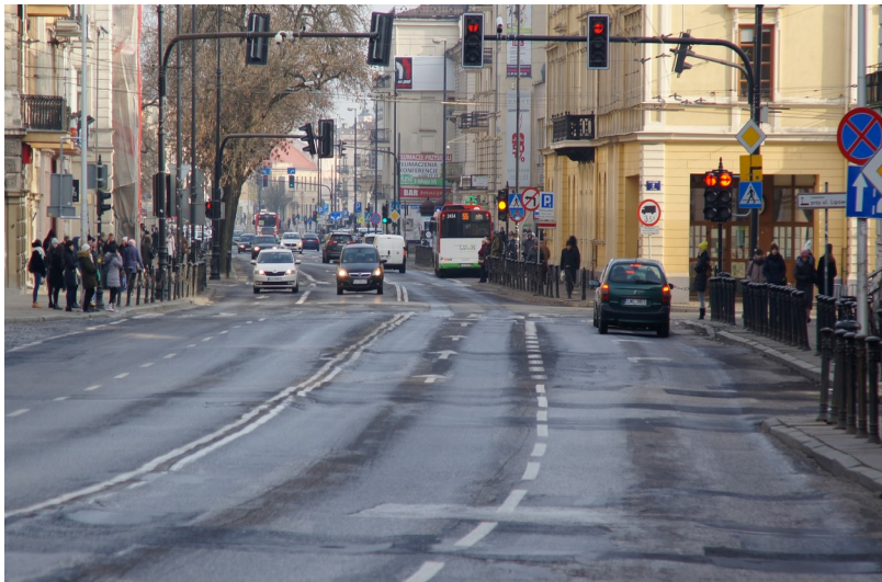
Ilustracja 2: Al. Racławickie w kierunku Krakowskiego Przedmieścia