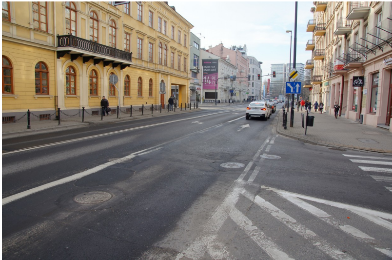
Ilustracja 1: Krakowskie Przedmieście w kierunku al. Racławickich