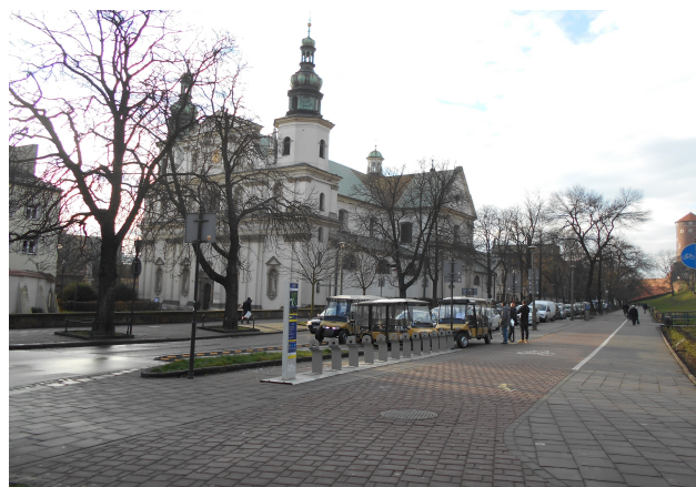
Ilustracja 2: Widok w kierunku ul. Bernardyńskiej